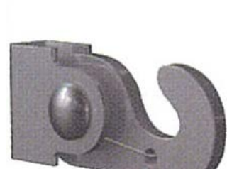
Crochet alu résistance jusqu'à 60 kg