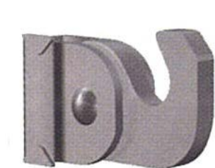
Crochet alu résistance jusqu'à 40 kg