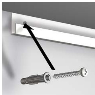
Fixation du rail au ras du plafond. Pour plafond et mur incliné, nous consulter.

Crochet antivol alu pour empêcher le crochet de sortir de la tige. Résistance : 40 et 60 kg.